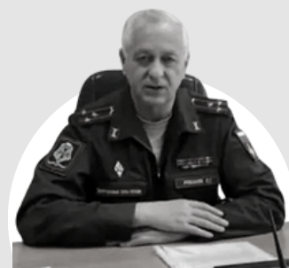
Романов Сурен Григорьевич Военный комиссар города Керчь и Ленинского района