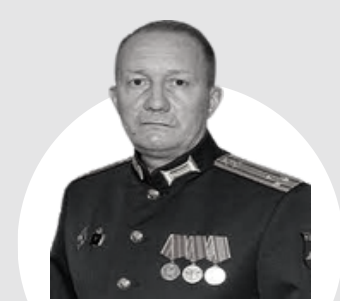
Кутузов Евгений Иванович Врио военного комиссара Автономной Республики Крым