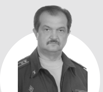
Саруханян Артур Оганесович Военный комиссар Черноморского и Роздольненского районов