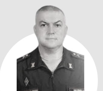
Нацвин Александр Петрович Военный комиссар города Джанкой, Джанкойского и Первомайского районов