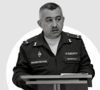
Качаров Константин Радикович Военный комиссар Симферопольского района и города Алушта