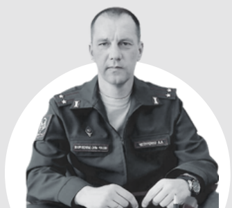
Чепуренко Александр Александрович Военный комиссар города Симферополь