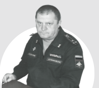
Должиков Константин Викторович Военный комиссар города Судак